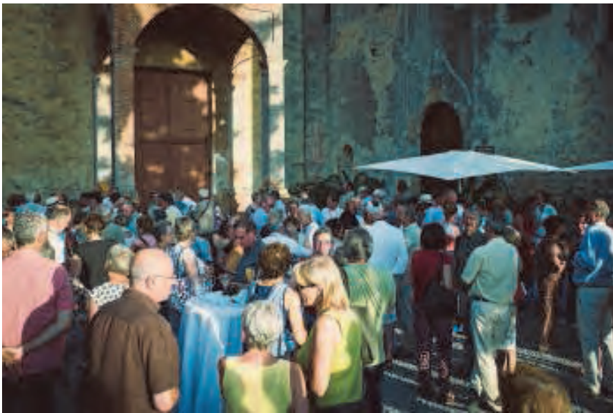
► Nog even geduld voor de kerk van Sant'Anna in Camprena.